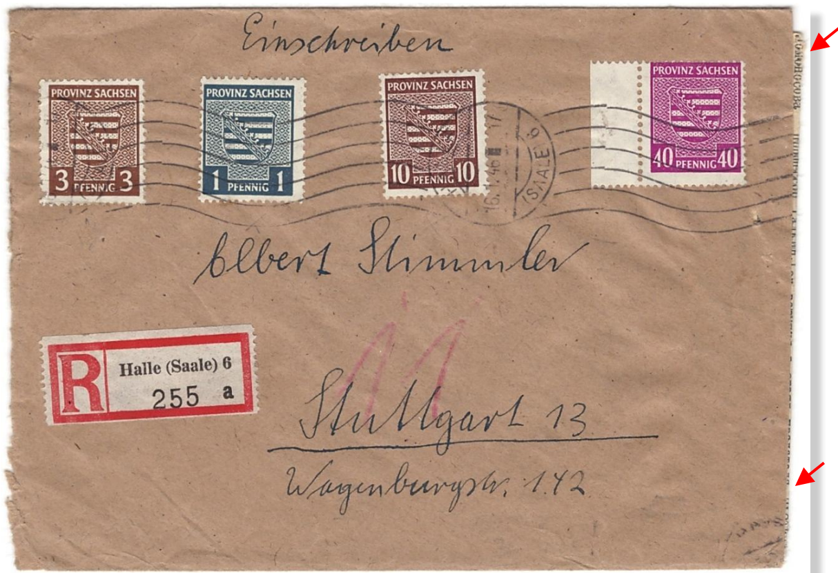
Abb. 1: Briefvorderseite als portogerechter Einschreibebrief (Gewichtsstufe 21 bis 250 g, in der 1. Tarifperiode), frankiert mit Mi.-Nrn. 73 X, 74 X, 78 X a und 84 X b, nach Stuttgart, aufgegeben in Halle, gestempelt mit Maschinenstempel HALLE (SAALE) 6, 16. 1.46 - 17. Der Brief durchlief eine „stille“ Zensur. Erkennbar am rechten Rand des Briefes, welcher zur Zensur geöffnet wurde und dann mit einem eingeklebten, gefalteten Ausschnitt einer sowjetischen Zeitung wieder verschlossen wurde. Bei diesem Beleg steht der Zeitungsausschnitt vorderseitig etwas über (siehe Kennzeichnung mit zwei roten Pfeilen am rechten Rand der Abbildung).

Nachfolgend möchte ich einen interessanten Beleg vorstellen, welcher besondere Merkmale der „stillen“ bzw. „stummen“ Zensur aufweist.